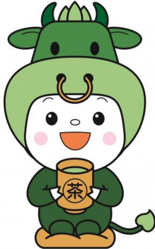
松阪市ご当地キャラ「ちゃちゃも」