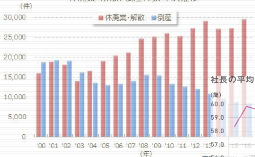
社長の平均年齢と交代率の推移