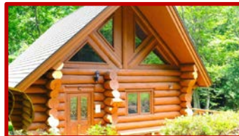
宮城県 / 別荘・空き家 (一棟貸切型)