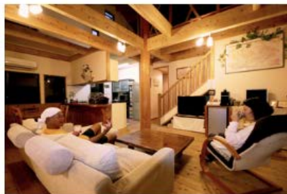
ホームステイ泊 | 沖縄県国頭郡