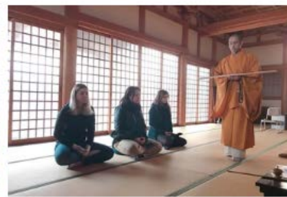
寺泊 | 広島県東広島市