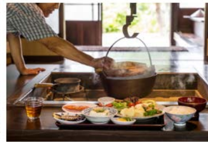
郷土料理泊 | 岩手県一関市