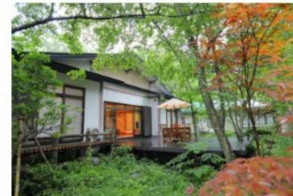
別荘泊 | 宮城県刈田郡

STAY JAPAN を運営する百戦錬磨は仙台が本社 (info@hyakuren.org)