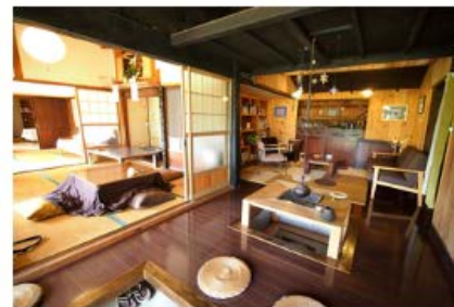
古民家泊 | 福島県二本松市