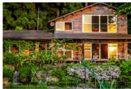
農泊 | 秋田県仙北市