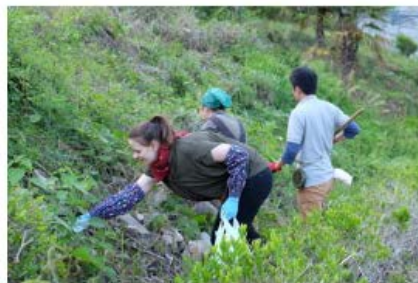
農泊 | 徳島県美馬市