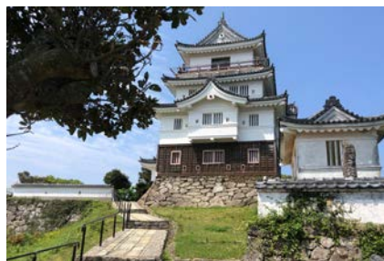
城泊 | 長崎県平戸市(2020年OPEN)