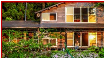
秋田県 / 農家民宿 (ホームステイ型)